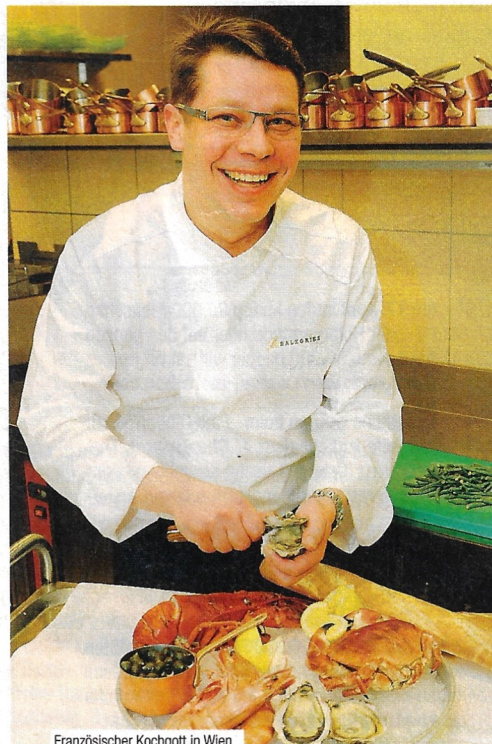
Französischer Kochgott in Wien